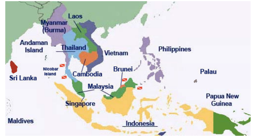
三大パーム油生産国—インドネシア、マレーシア、タイ Indonesia, Malaysia and Thailand, the world's three largest palm oil producers